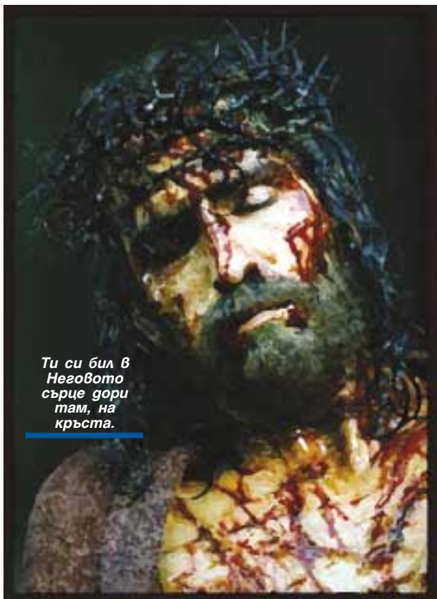
Ти си бил в Неговото сърце дори там, на кръста.

И когато приближава небето и Божията слава Го огря, серафими и херувими напускат Божия престол, за да Го посрещнат. Ангелският хор започва да пее (Псалм 24). С неговите звуци Исус бива въведен в небесните дворове. И серафими и херувими