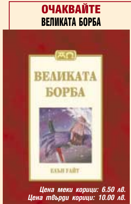
Цена меки корици: 6.50 лв. Цена твърди корици: 10.00 лв.

Тази книга представява задълбочено и съвременен увлекателно изследване върху грандиозната панорама на Библията. С нея се връщаме назад в историята на човешкия род, както е записана в книгата Битие. Научаваме как Бог се е отнесъл към бунта на хората, а също и за удивителната Божия благодат и любещата грижа за спасяването на човека. Преминваме през времето на библейските патриарси, когато плановете и намеренията на Бога са се откривали ясно на избрания Му народ.