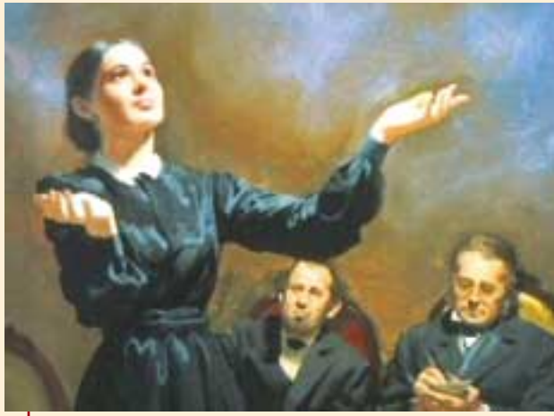
Елън Уайт (1827-1915)

Една от най-издаваните писателки в света. Изнесла е хиляди проповеди върху библейски сюжети и здравни въпроси в трите континета: Европа, Америка и Австралия.