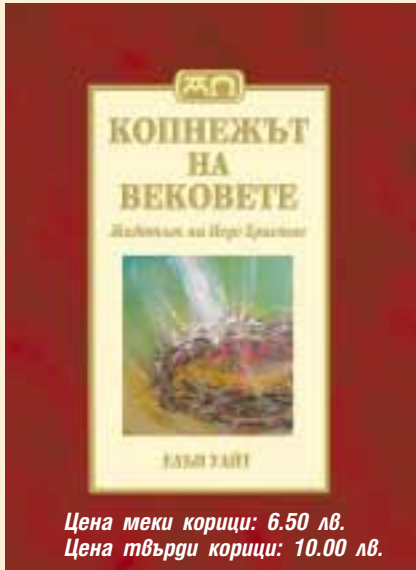
Цена меки корици: 6.50 лв. Цена твърди корици: 10.00 лв.